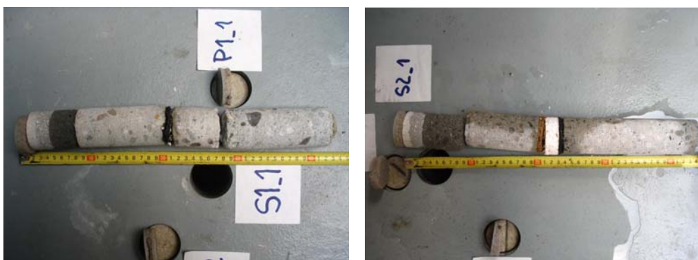
Obrázek č. 4 – Skladba průmyslové podlahy v jádrovém vývrťu S1_1 a S2_1

Pomocí jádrových vývrťů \varnothing 50 mm byla zjištěna skladba souvrství materiálů posuzované rekonstruované podlahy až k podkladní vrstvě ze šterkopísku (Obrázek 4). Současně byla stanovena kontaktním měření mocnost jednotlivých vrstev (Tabulka 2).