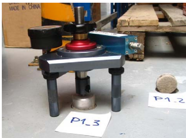
Obrázek č. 5 – Zkouška přídržnosti pomocí odtrhoměru DYNA Z6

Jak bylo uvedeno, poruchy v rekonstruované průmyslové podlaze se projevují lokálním rozpadem nosné polymerbetonové vrstvy, což je způsobeno vydrolením zrn plniva, tj. křemičitého písku ISG (Obrázek 2, 3). Mechanismus tohoto časově závislého procesu poškození podlahy je s největší pravděpodobností následující. Prvotně dojde k narušení a rozpadu nekvalitního spojovacího můstku mezi penetračním nátěrem Lena P100 a nosnou polymerbetonovou vrstvou Lena P130. Při dalším mechanickém namáhání podlahy od pojezdu paletových vozíků a vysokozdvizných vozíků dochází k opakovaným cyklickým deformacím (stlačování a vzdouvání nosné vrstvy) a následné degradaci této vrstvy až do sypkého stavu.