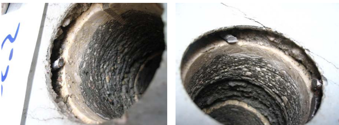
Obrázek č. 3 – Detail lokálního rozpadu nosné polymerbetonové vrstvy vydrolením zrn plniva