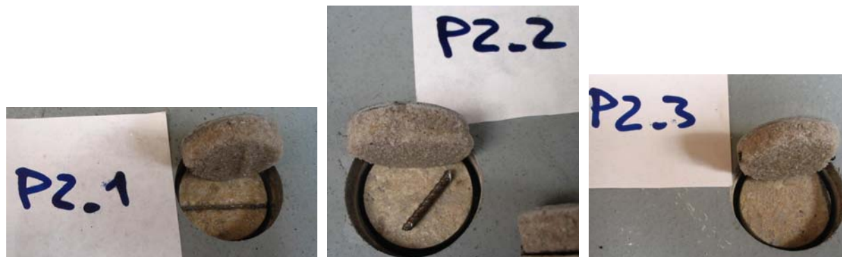
Obrázek č. 6 – Charakter poškození posuzovaného souvrství v místech zkoušek přídržnosti

První příčinou vzniku poruchy byl identifikován pomocí zkoušek přídržnosti nekvalitní spojovací můstek mezi penetračním nátěrem Lena P100 a nosnou polymerbetonovou vrstvou Lena P130. Zkoušky přídržnosti byly prováděny dle metodiky [5] na válcových tělesech Ø50 mm. Válcová tělesa byla připravena jádrovým diamantovým vrtákem. Při zkouškách přídržnosti byl použit odtrhoměr DYNA Z6. Uspořádání zkoušky přídržnosti je zobrazeno na Obrázku 5 a 6. Experimentálně zjištěná kohezni pevnost se pohybovala v intervalu 0.03 MPa až 0.96 MPa, což je ve smyslu ČSN 744505 čl. 3.8.3 nedostatečné a nevyhovující (normou požadovaná hodnota kohezni pevnosti je 1.50 MPa).