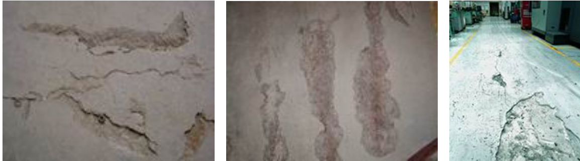
Obrázek č. 1 – Příklady poruch těžkých plovoucích podlah (trhliny, výtluky, nerovnosti)

Mezi nejčastější poruchy těžkých plovoucích podlah patří (Obrázek 1) [2] trhliny, výtluky, dutá místa, nerovnosti, „prášení“ betonu, odlupování nátěrů nebo stěrek a poškození podlahy chemickými vlivy nebo její znehodnocení účinkem ropných produktů.