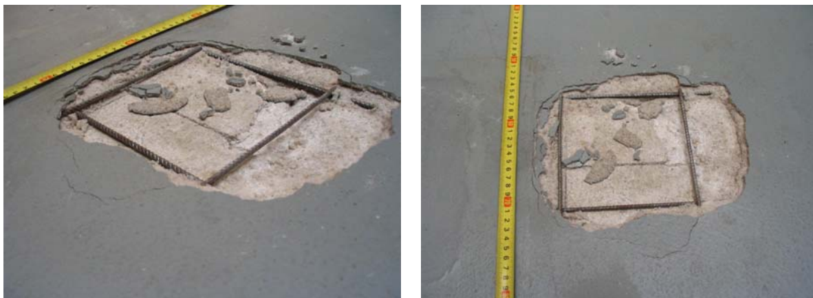
Obrázek č. 2 – Poškození podlahy, kdy dochází k totálnímu rozpadu nosné polymerbetonové vrstvy