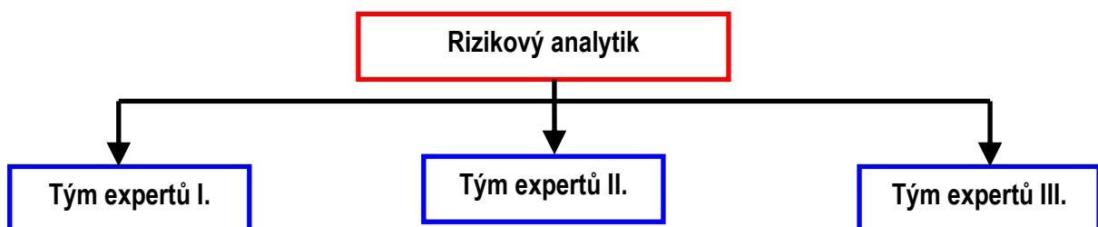
Obrázek 1: Týmy expertů

Cílem této expertní rizikové metody je s co největší přesností poskytnout informaci o zdroji nebezpečí v návaznosti na důsledky jeho vzniku a předpokládané míře jeho výskytu, což přímo souvisí s ekonomickými ukazateli – v případě stavby s investičními náklady nebo finančními náklady na rekonstrukci (sanaci) objektu. Názorně je situaci možno zobrazit jako schéma: