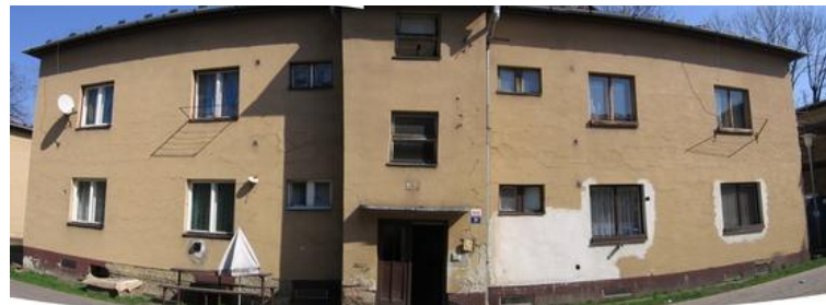
Obrázek 3 : Celkový pohled na bytový dům Stromovka 21/1438

V praktickém případě bylo provedeno hodnocení stávajících objektů s tím, že byly vybrány převážně kritéria se shodným stupně závažnosti S_v , tedy se stejnou vahou různých kritérií.